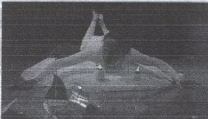
CRÉATION. D'avant le monde à la venue au monde, un voyage initiatique pour les tout-petits.

Yemma signifie « maman » en berbère. « Maman », le premier mot d'une langue, d'une vie, « Yemma », le tout premier spectacle des tout-petits. Cette création de Lili Label Compagnie s'adresse aux enfants de 18 mois à trois ans.