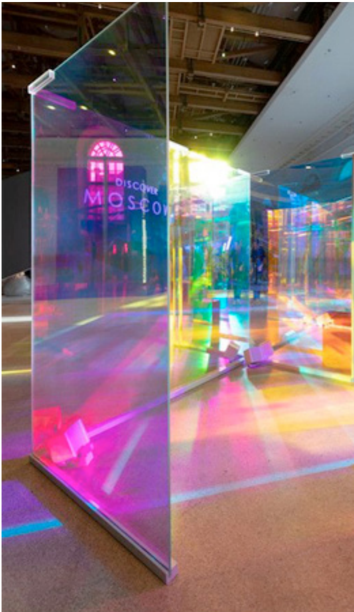
photo d'inspiration / Gallery of FutureMateriality Pavilio/Pravda - Los Angeles

Leur terrain de jeu s'amplifie lorsque la narration bascule sur le souvenir des enfants cruels qu'étaient ces deux laborantins, Ils détournent les objets et éléments de leur laboratoire pour servir ce récit et susciter l'imaginaire.