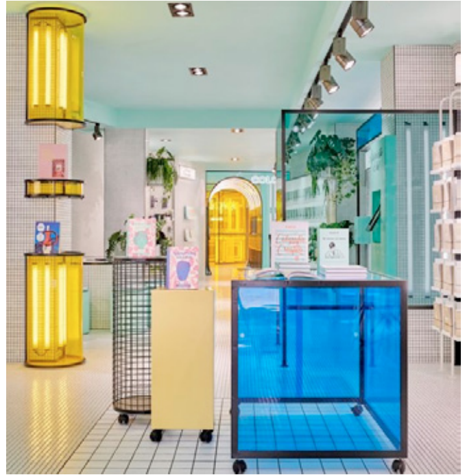
photo d'inspiration / Cuadernos Rubio

La table de démonstration quant à elle, se pare de parois translucides, aux effets colorés changeants, se reflétant tour à tour sur les comédiens, les objets, le sol.